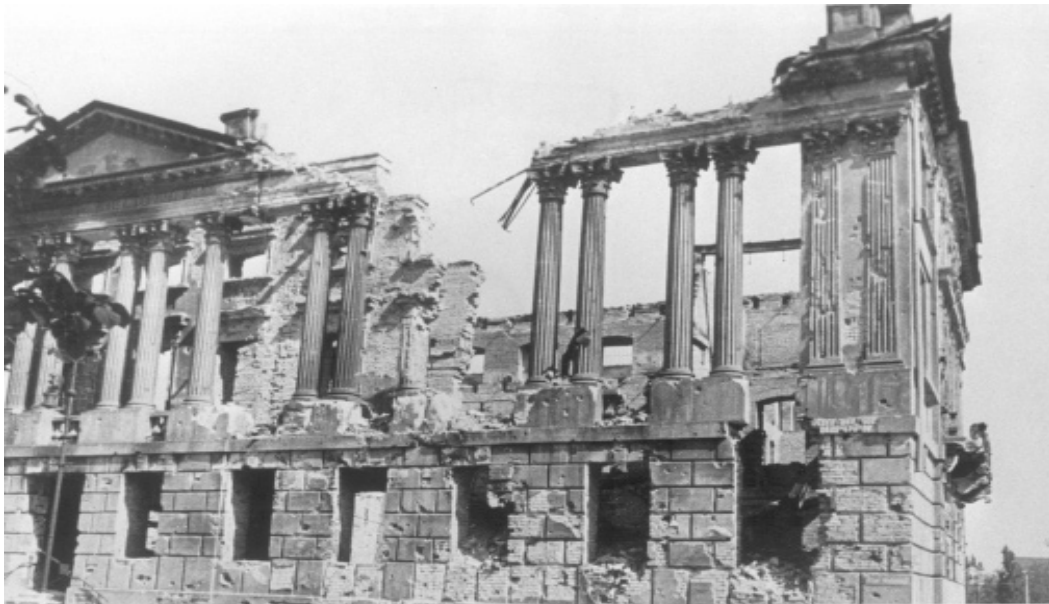
Biblioteka Raczyńskich rok 1945