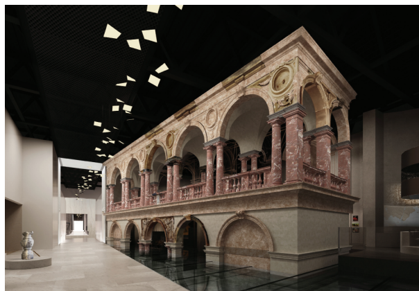
Wizualizacja – wystawa stała MHP (galeria Dawna Rzeczypospolita). Projekt WWA.A. Platige Image