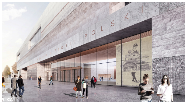
Wizualizacja – widok budynku Muzeum Historii Polski od strony Placu Gwardii (wejście główne). Projekt: WXCA