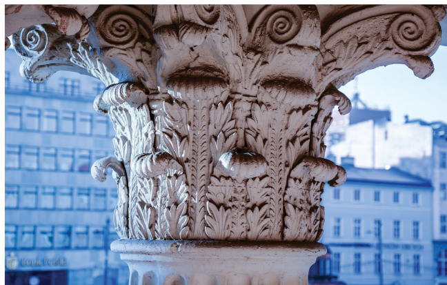
Biblioteka Raczyńskich (fragment budynku)