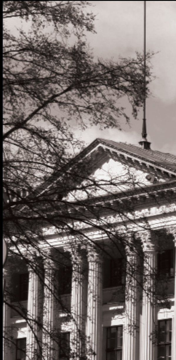
Biblioteka Raczyńskich