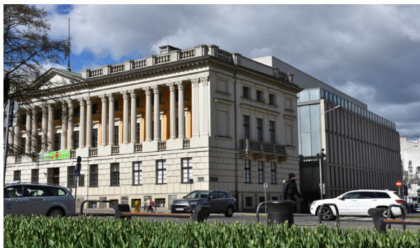
Biblioteka Raczyńskich

Księgozbiór Biblioteki Raczyńskich liczy dziś niemal 2 miliony woluminów. Najcenniejsze pod względem naukowym i zabytkowym są zbiory specjalne, na które składają się rękopisy, stare druki, kartografia, grafika, fotografie,