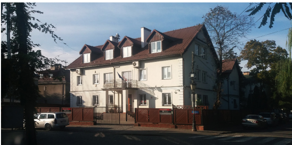
Siedziba Narodowego Instytutu Muzealnictwa i Ochrony Zbiorów