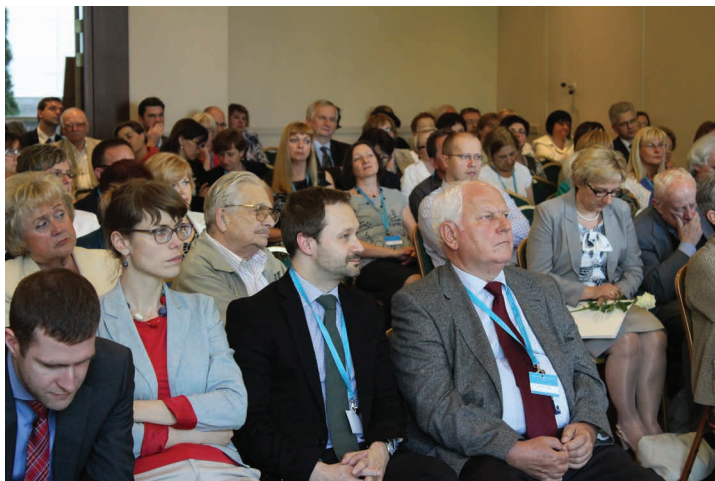
Uczestnicy i goście Krajowego Zjazdu Delegatów