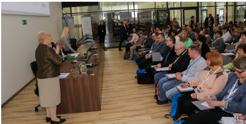
Uczestnicy XI Ogólnopolskiej Konferencji z cyklu „Automatyzacja bibliotek”

kształcające online, przyszłość standardów katalogowania i katalogów OPAC, wykorzystanie elektronicznych źródeł informacji i zarządzanie zasobami cyfrowymi to tematy referatów i dyskusji panelowych, które cieszyły się dużym zainteresowaniem wśród bibliotekarzy z różnych typów bibliotek, gdyż wiedza o nowych zjawiskach w świecie technologii cyfrowych jest niezbędna zarówno w małej bibliotece publicznej, jak i w dużym ośrodku akademickim.