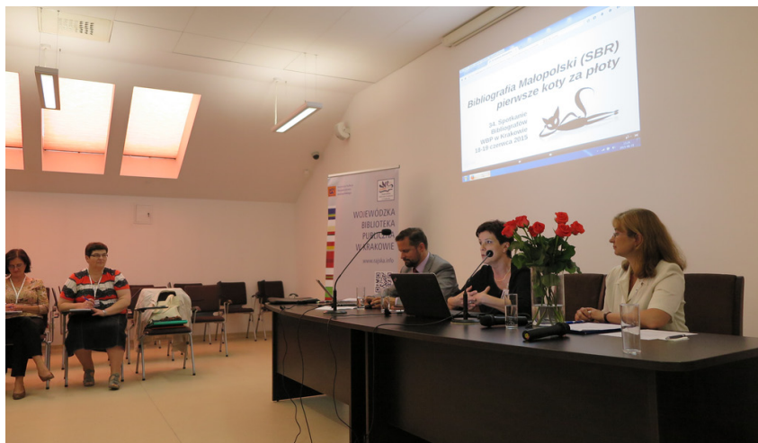
Spotkanie Zespołu ds. Bibliografii Regionalnej ZG SBP

nicy konferencji byli zgodni, że rola bibliografa w erze cyfryzacji zdecydowanie wzrasta. Ponadto podkreślili konieczność sprostania oczekiwaniom współczesnego użytkownika, dostosowania zarówno katalogów bibliotecznych, bibliografii, jak i zasobów cyfrowych do jego kompetencji informacyjnych. Uczestnicy spotkania zwiedzili Bibliotekę Główną Akademii Górniczo-Hutniczej, Artetkę WBP w Krakowie oraz odbyli spacer po mieście.