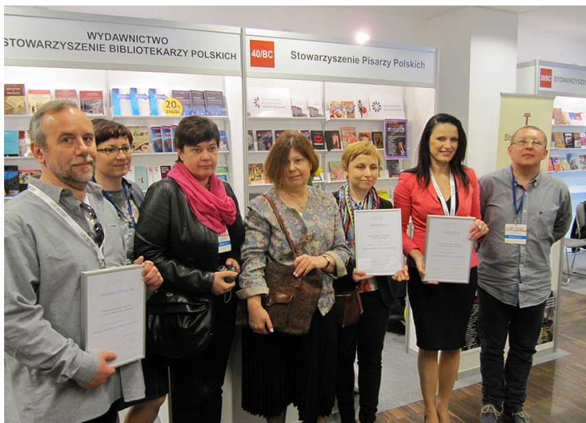
Laureaci konkursu „Mistrz Promocji Czytelnictwa 2014” przy stoisku SBP na Warszawskich Targach Książki

Uroczystość wręczenia nagród odbyła się podczas VI Warszawskich Targów Książki, w dniu 24 maja 2015 r.