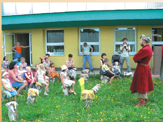
„Podróże bez granic rycerskim szlakiem”