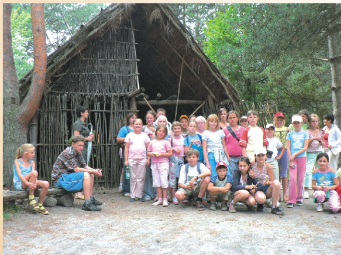
Wakacje z biblioteką „W krainie Świętokrzyskiej”