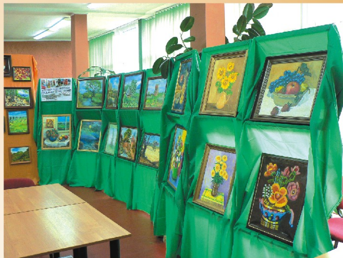
Prace artystów malujących ustami i nogami