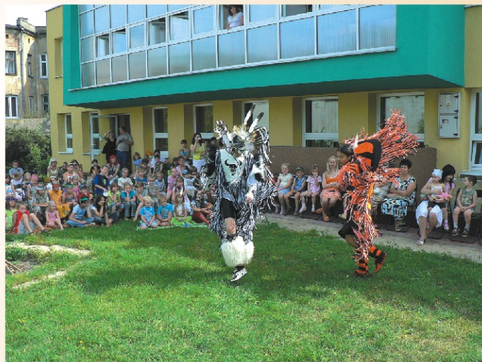
Wakacje z biblioteką „Indiańskie wakacje”